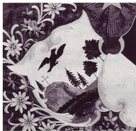
Altes Gemeindewappen auf der Fahne der Schützengesellschaft 1909