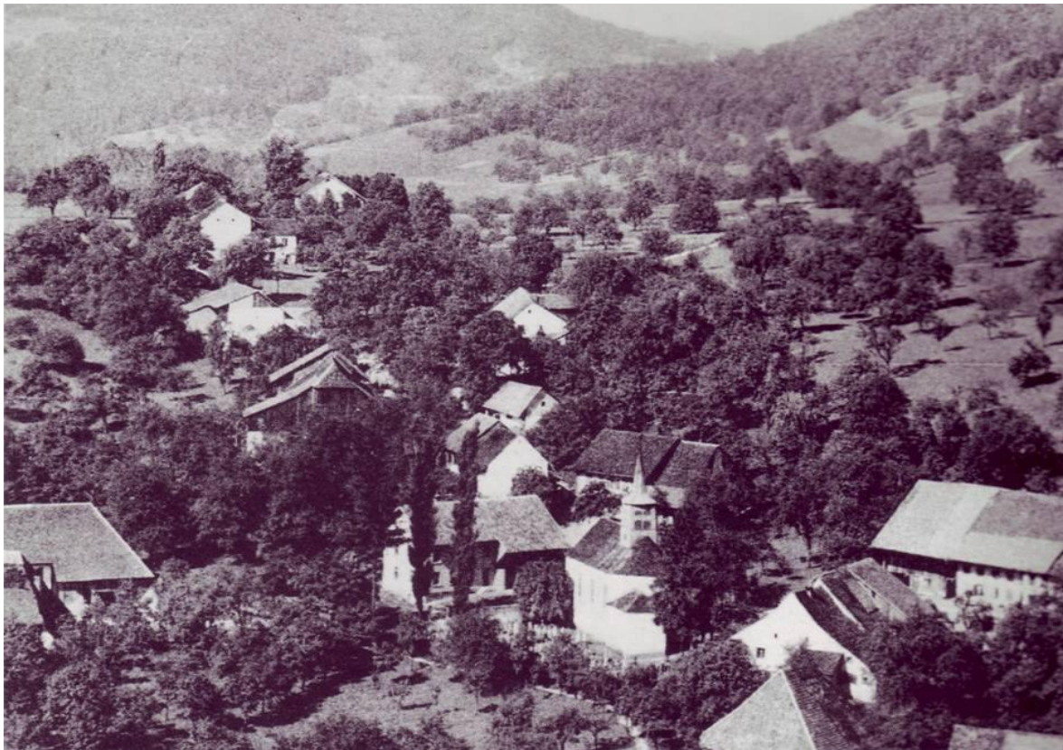
Alte Dorfansicht anfangs 20. Jahrhundert