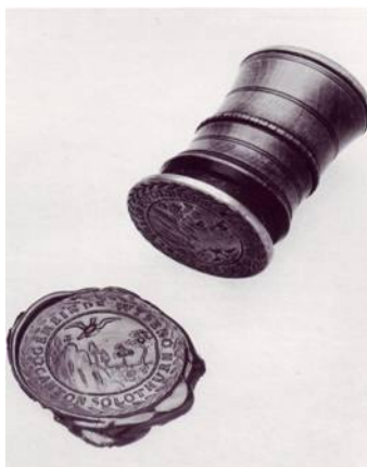
Handsiegel mit dem alten Gemeindewappen

Mit RRB 2313 vom 13. Mai 1947 hält die Regierung aber fest, dass die Gemeinde Wisen keine wichtigen Gründe für eine Änderung des Gemeindewappens geltend machen könne. Der Adler sei nicht nur das Hoheitszeichen Deutschlands und zudem eigne sich das vorgeschlagene Landschaftsbild mit dem Fluhberg schlecht als Gemeindewappen. So wurde das Gesuch abgelehnt, und Wisen behielt seinen Adler im Wappen.